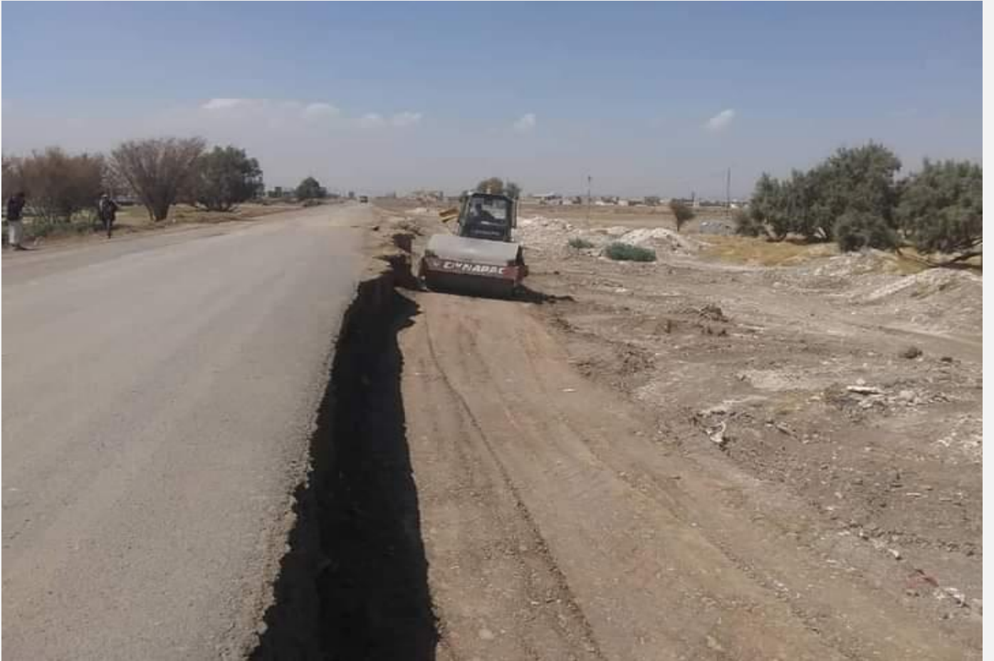
مشروع تنفيذ معالجة اضرار السيول الخط الرئيسي بني جرموز (حارة خير) مديرية بني الحارث