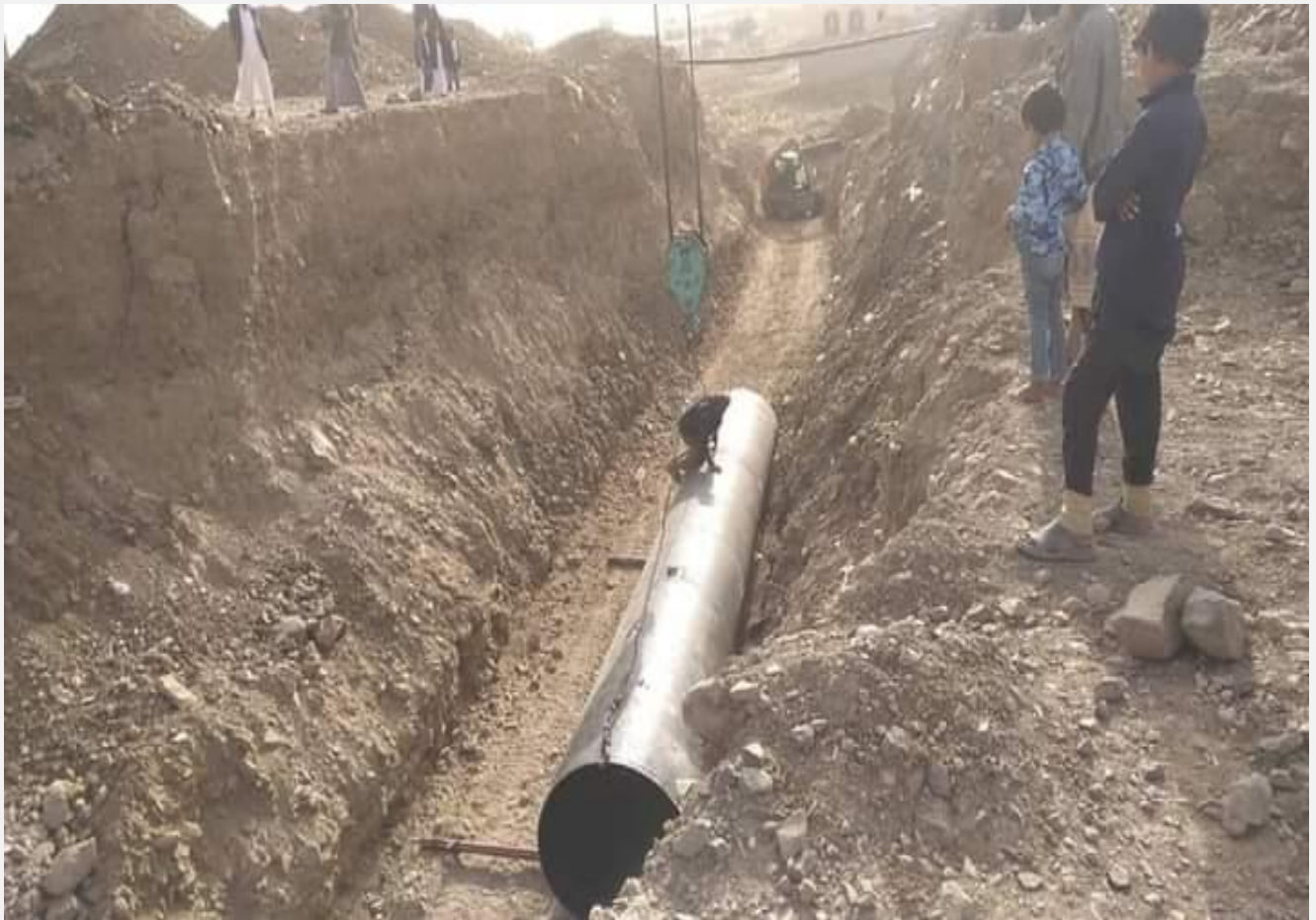
مشروع تنفيذ قناة تصريف مياه الامطار شارع الأربعين شعب الحافة مديرية شعوب