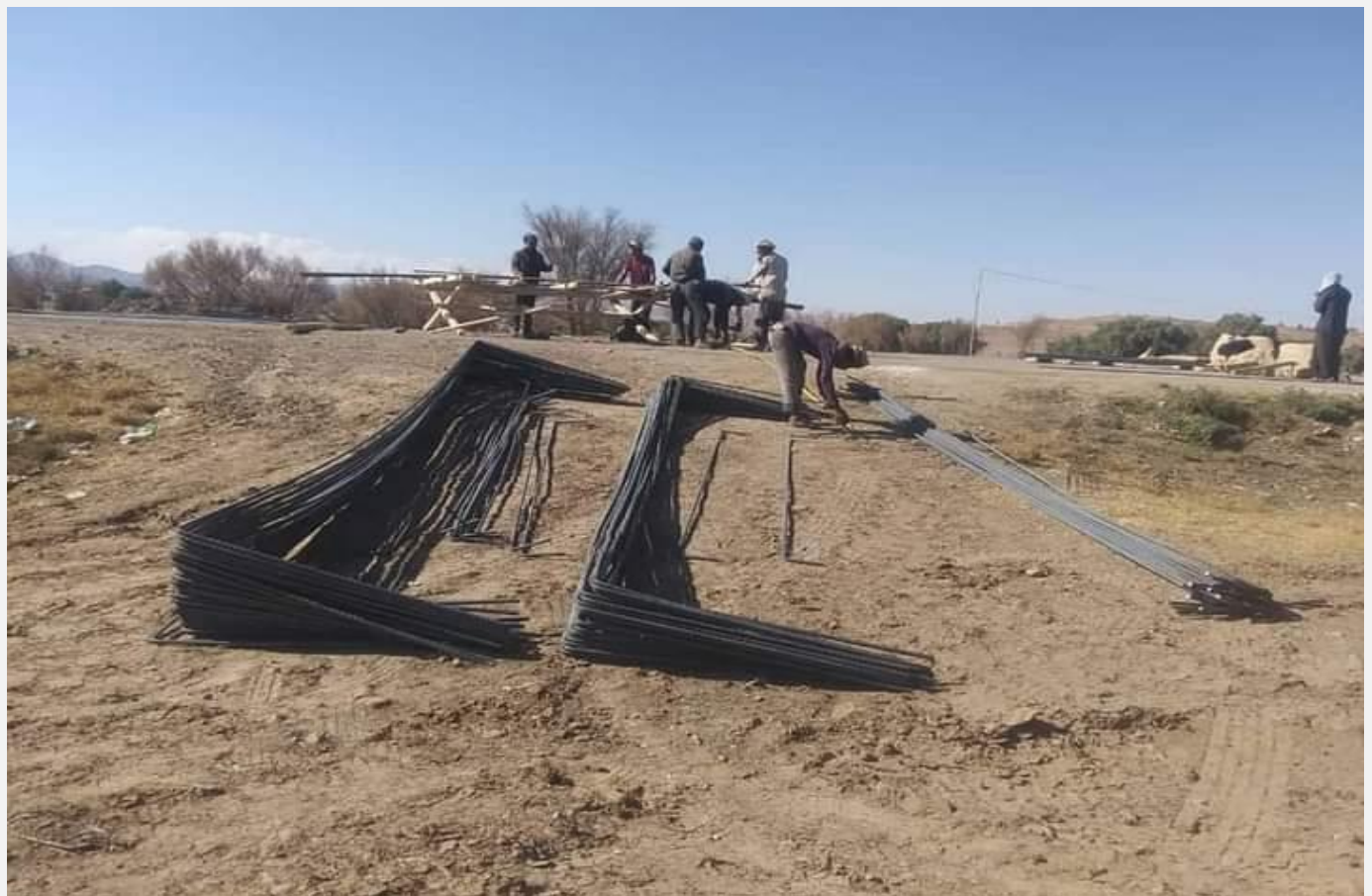
مشروع تنفيذ معالجة اضرار السيول الخط الرئيسي بني جرموز (حارة خير) مديرية بني الحارث