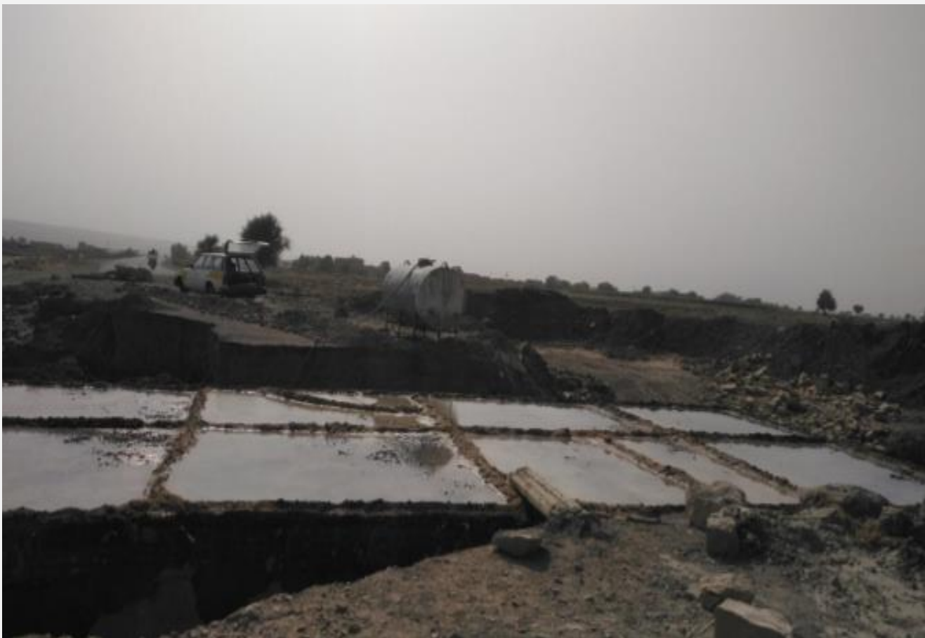
مشروع تنفيذ معالجة اضرار السيول الخط الرئيسي بني جرموز (حارة خير) مديرية بني الحارث