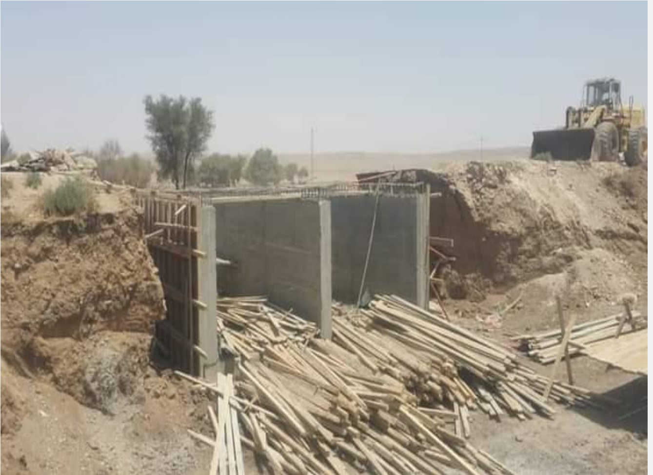
مشروع تنفيذ معالجة اضرار السيول الخط الرئيسي بني جرموز (حارة خير) مديرية بني الحارث