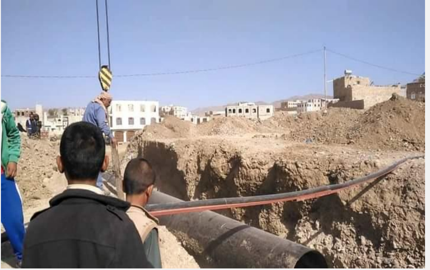
مشروع تنفيذ قناة تصريف مياه الامطار شارع الأربعين شعب الحافة مديرية شعوب