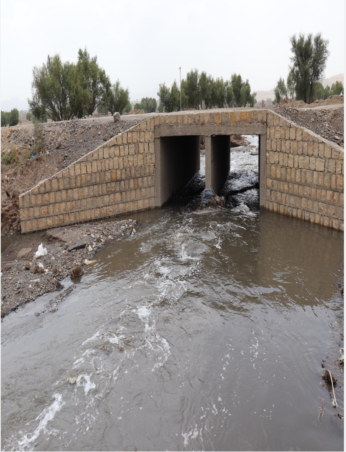
مشروع تنفيذ معالجة اضرار السيول الخط الرئيسي بني جرموز (حارة خير) مديرية بني الحارث