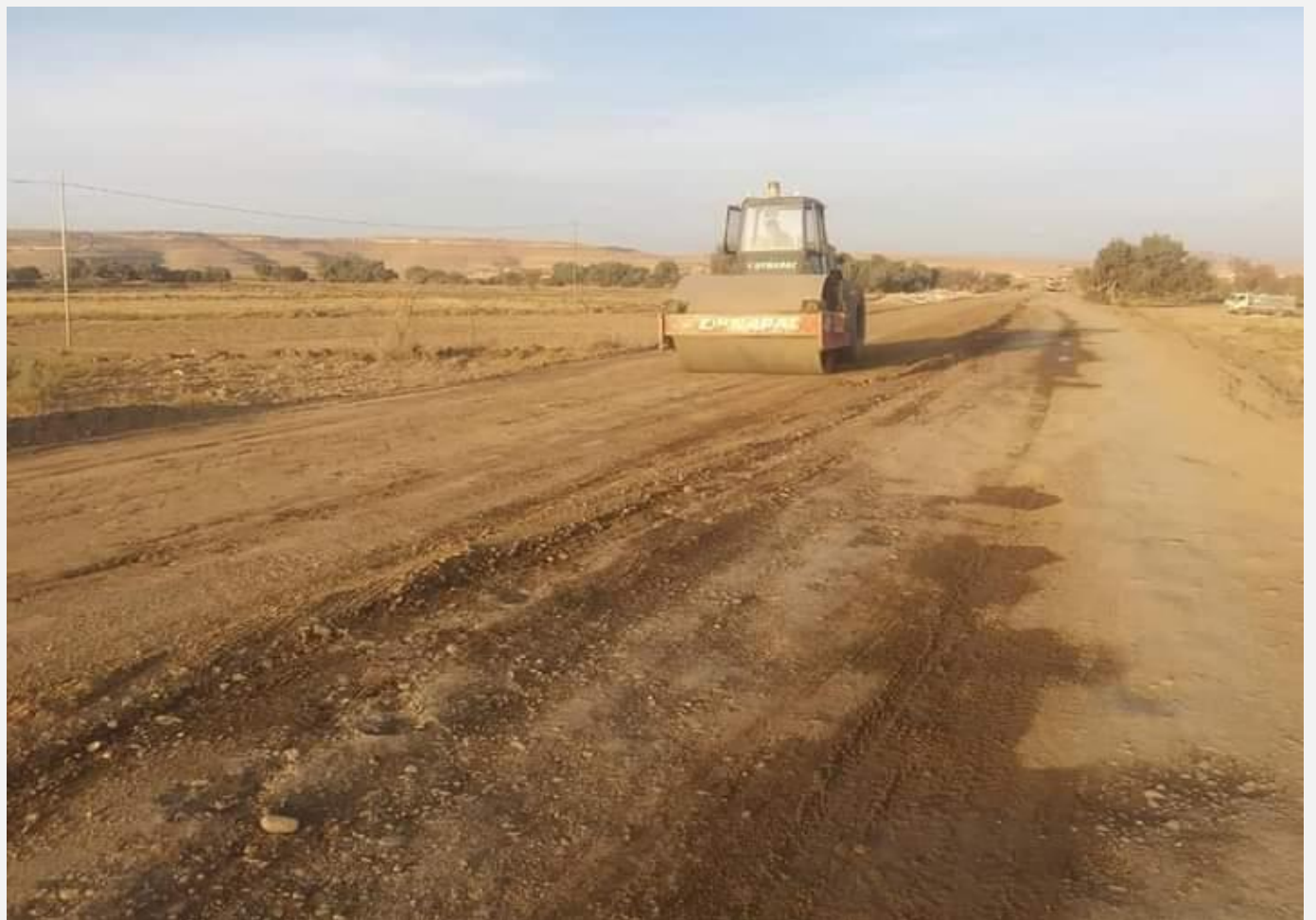
مشروع تنفيذ معالجة اضرار السيول الخط الرئيسي بني جرموز (حارة خير) مديرية بني الحارث