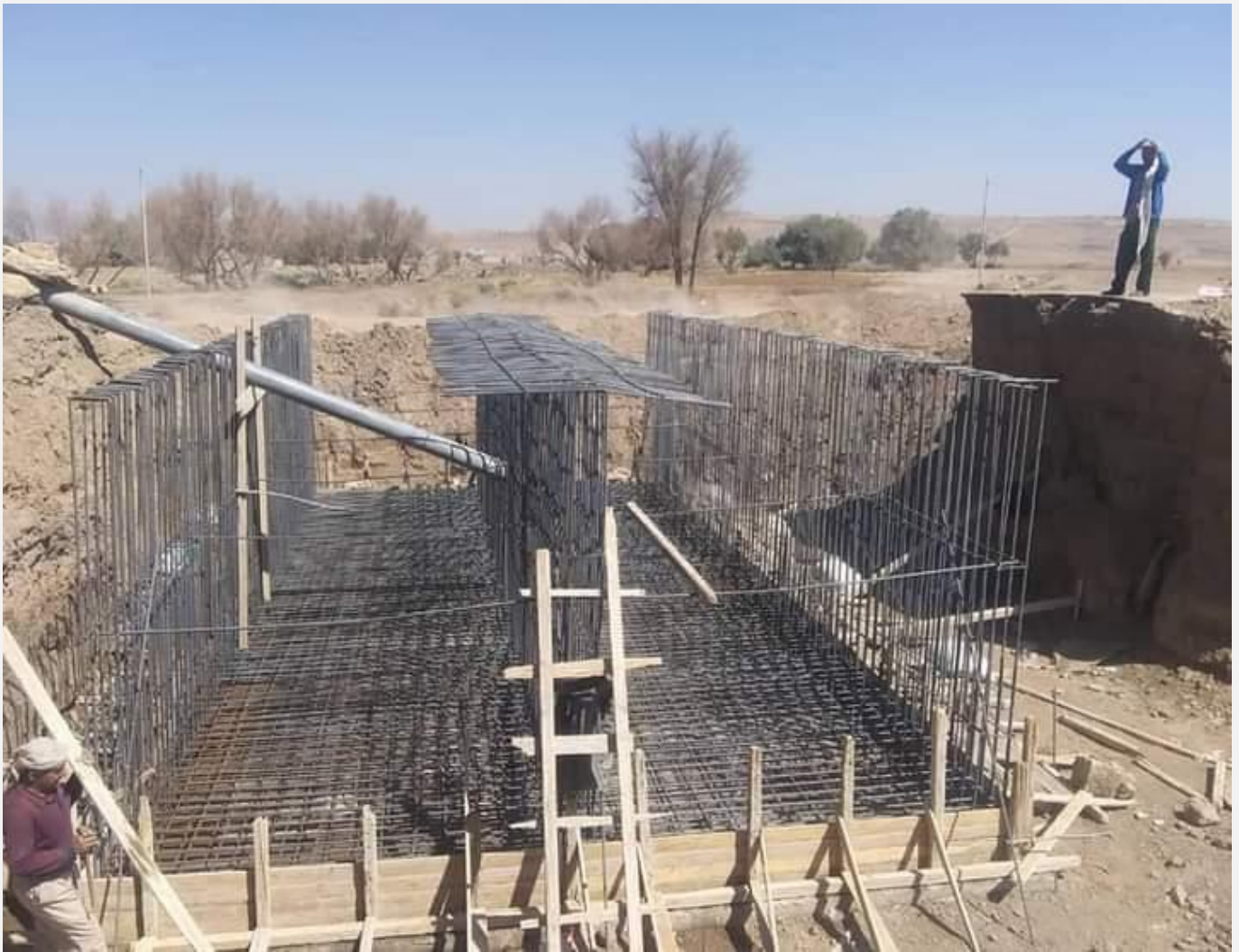
مشروع تنفيذ معالجة اضرار السيول الخط الرئيسي بني جرموز (حارة خير) مديرية بني الحارث