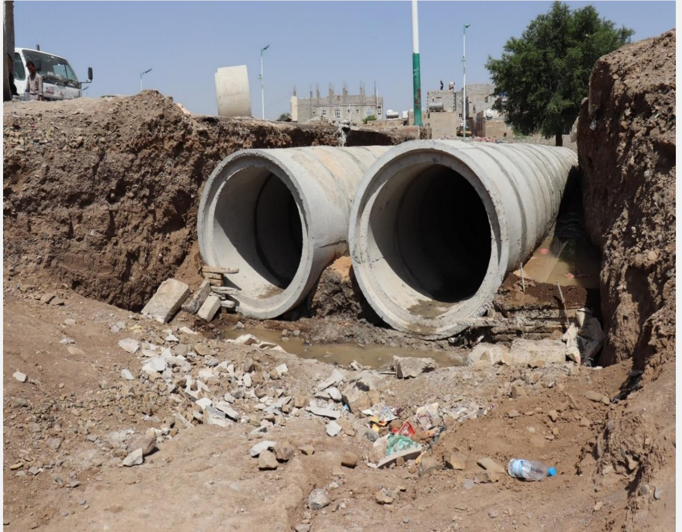
مشروع قناة تصريف مياة الامطار لتقاطع شارع الخمسين مع شارع السلال - مديرية بني الحارث