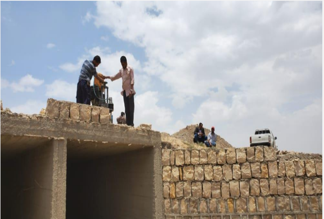
مشروع تنفيذ معالجة اضرار السيول الخط الرئيسي بني جرموز (حارة خير) مديرية بني الحارث