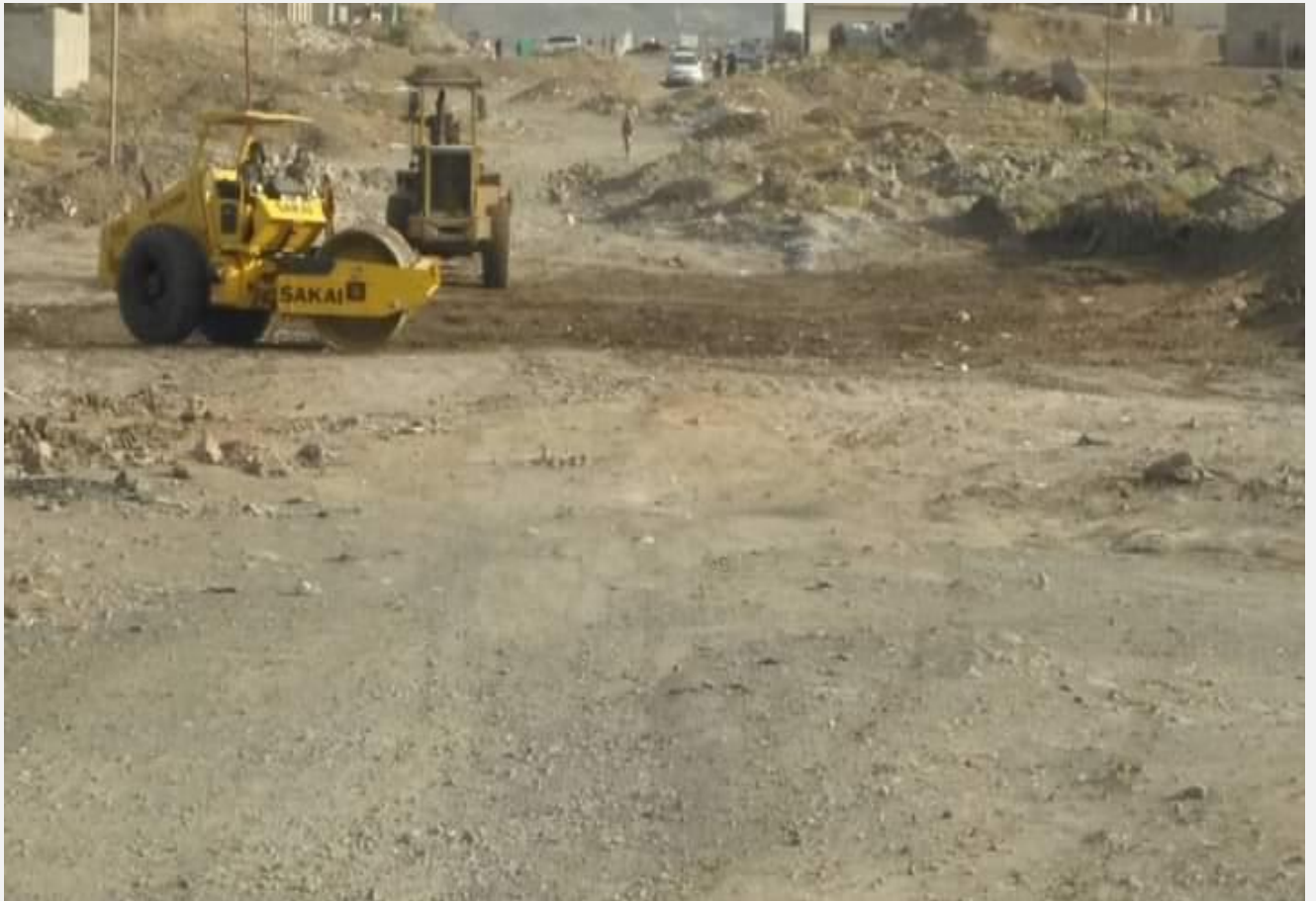
مشروع تنفيذ قناة تصريف مياه الامطار شارع الأربعين شعب الحافة مديرية شعوب