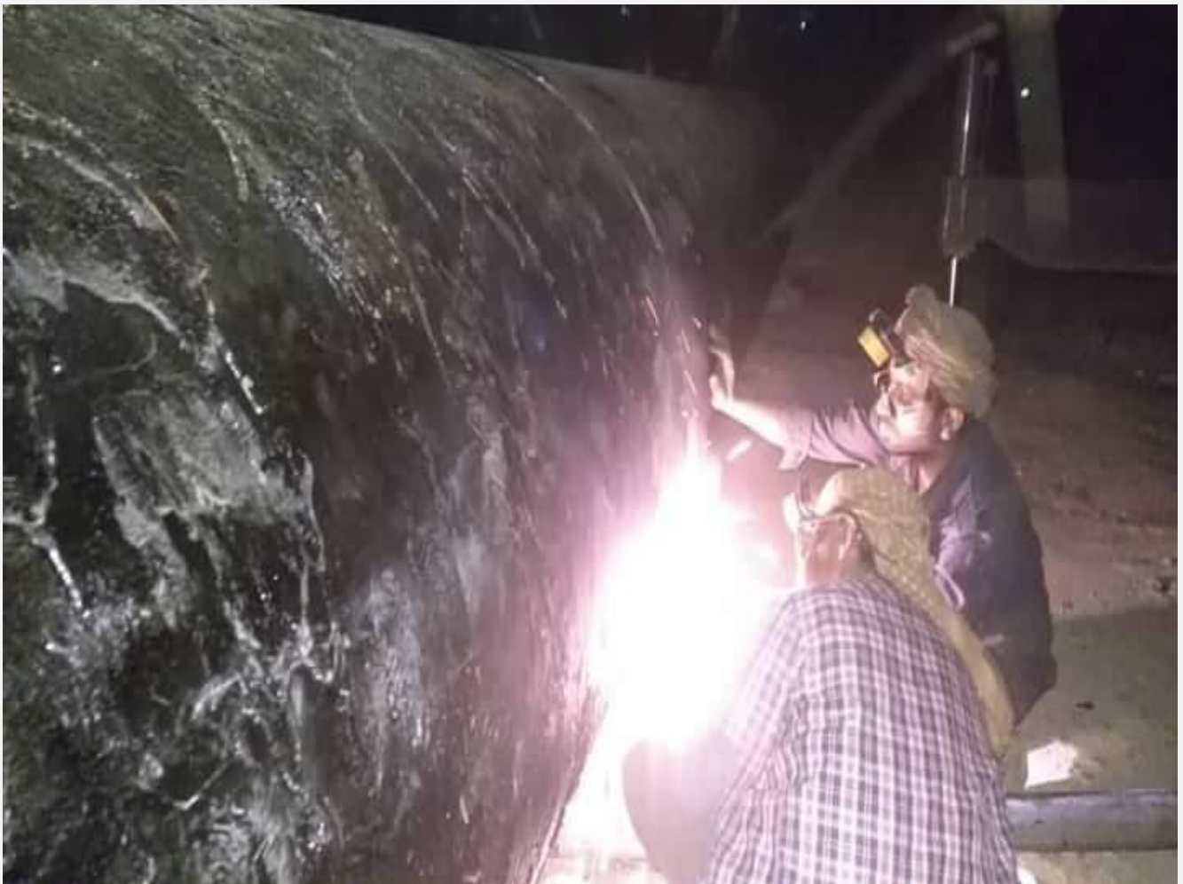
مشروع تنفيذ قناة تصريف مياه الامطار شارع الأربعين شعب الحافة مديرية شعوب