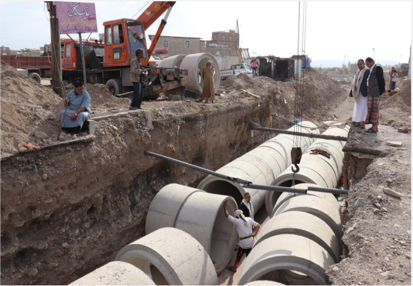
مشروع قناة تصريف مياة الامطار لتقاطع شارع الخمسين مع شارع السلال - مديرية بني الحارث