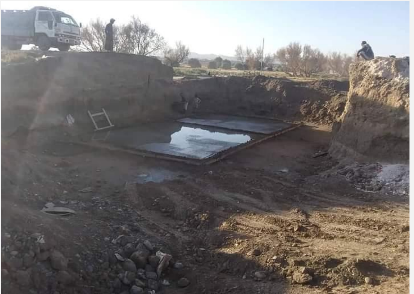
مشروع تنفيذ معالجة اضرار السيول الخط الرئيسي بني جرموز (حارة خير) مديرية بني الحارث