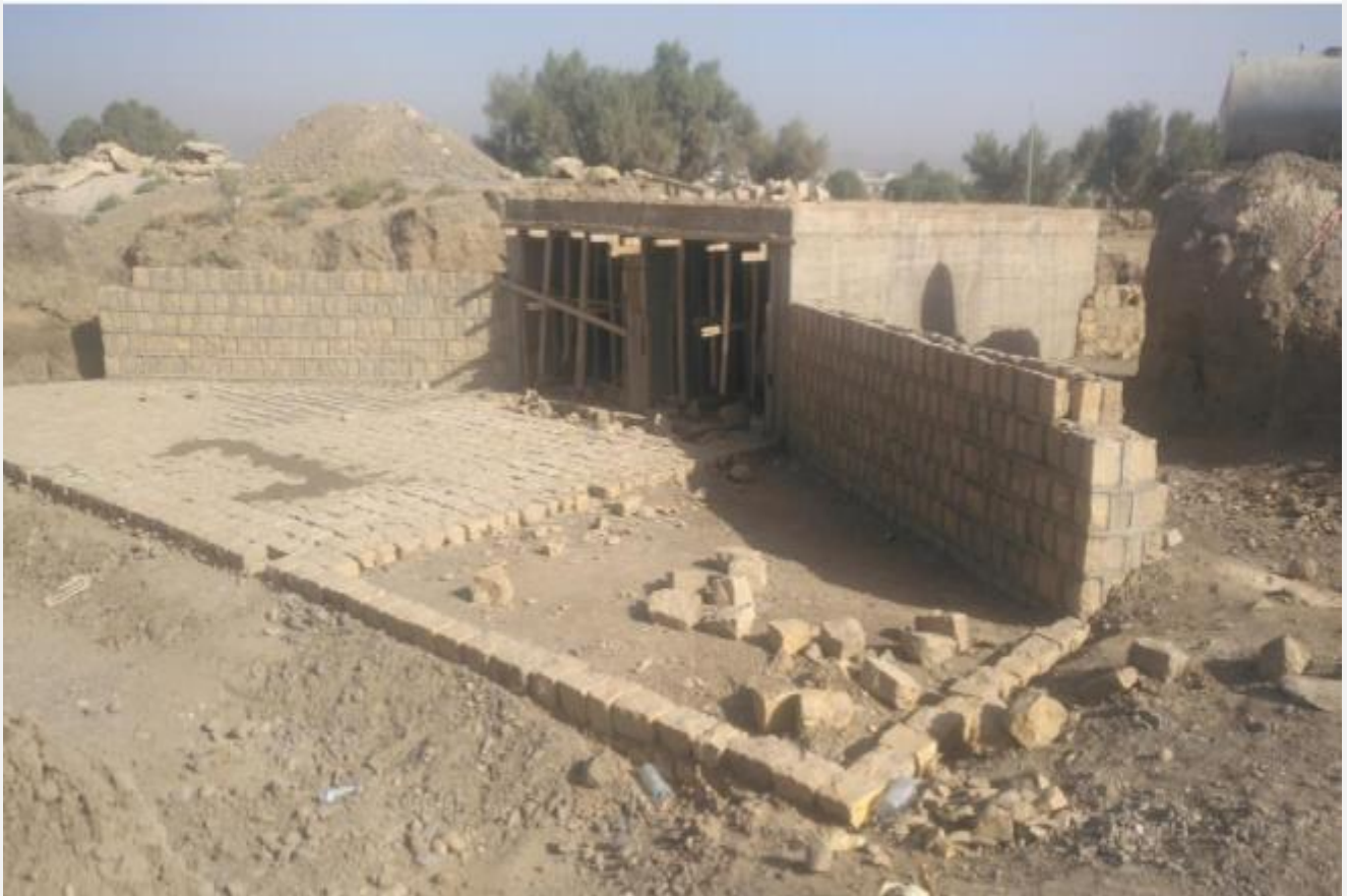
مشروع تنفيذ معالجة اضرار السيول الخط الرئيسي بني جرموز (حارة خير) مديرية بني الحارث